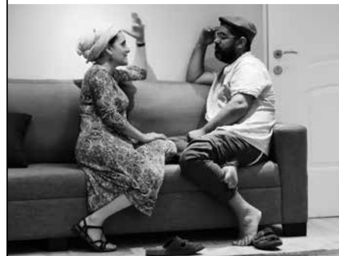
◀ הרבה פעמים קונפליקט זוגי נובע לשאלה: מה נחשב להשקיע בזוגיות שלנו? הזוג יפרח מבקשים לברר ולפתור קונפליקטים

את השנים הלא מעטות של גידול ילדים קטנים ותפעול הבית, מכנים הזוג יפרח "שלב שיתוף הצרכים", שבו מרכז הזוגיות הוא המפעל הביתי המשותף. "אם נכניס את הזוגיות לבידם במשך