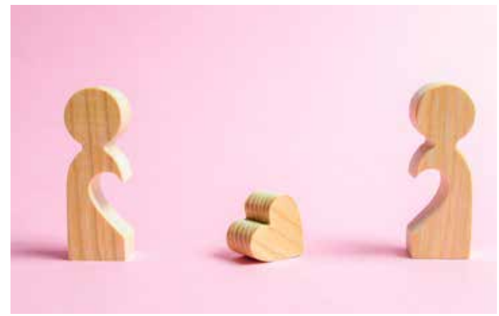
◀ תפיסת המרחב הזוגי כגורם מרכזי בבית מפנה את תשומת הלב לדינמיקה שבין בני הזוג אילוסטרציה